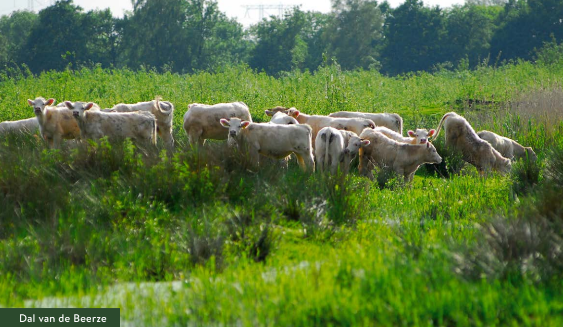
Dal van de Beerze