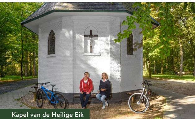
Kapel van de Heilige Eik

Even verderop staat een grondwatermeter. Hier zie je hoe hoog het grondwater staat. Een goede hoge grondwaterstand is goed voor planten en dieren. Maar Noord-Brabant wordt steeds droger. Samen met de provincie en gemeenten nemen we maatregelen om in ons hele gebied meer regenwater vast te houden. Ook jij kunt je steentje hieraan bijdragen. Op het informatiebord lees je hier meer over.