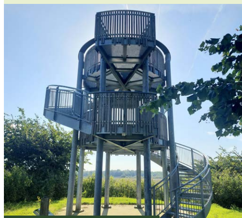
Tour de Frans op Banisveld

Kp 9 – kp 46 | Op kruising bij kp 9 RD Langendonksedijk. Bij kruising RA Heibloemdijk ( kijkpunt B ). Einde RA , Logtsebaan (routen netwerk verlaten) Op kruising LA doodlopende onverharde weg, Achtbunderse Dijk. Op kruising schuin L veerooster over en