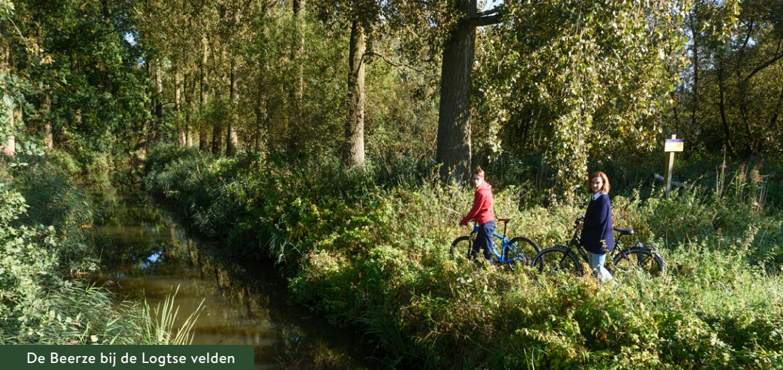
De Beerze bij de Logtse velden